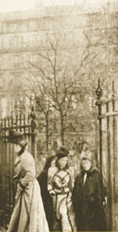
La Madeleine, Paris

This edition of the Complete Works is based on international research conducted during the past four decades on both musical and literary sources, the correspondence, iconography and historical recordings. It has brought together musicologists of five different nationalities who share the same fascination for this unique music. This eagerly awaited edition will reveal much new material while furthering the international dissemination of a musical oeuvre that continuously attracts new enthusiasts.