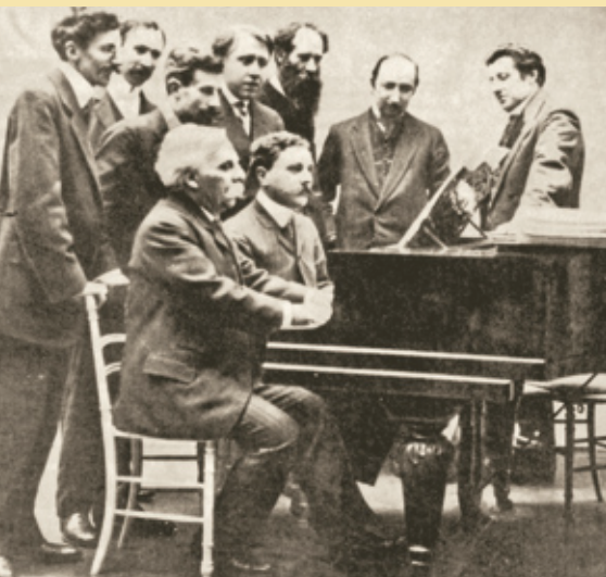
G. Fauré et les élèves de sa classe de composition. À ses côtés, au piano : Jean Roger-Ducasse, derrière Fauré, avec une barbe : Maurice Ravel

Der Editionsleiter der Œuvres complètes de Gabriel Fauré widmet Gabriel Fauré seine wissenschaftliche Arbeit bereits seit mehr als dreißig Jahren. Er veröffentlichte fünf Standardwerke zum Komponisten: Fauré (Paris, 1972, 3 1995), Correspondance Saint-Saëns, Fauré (Paris, 1973, 2 1994), Phonographies. Gabriel Fauré 1900-1977 (Paris, Bibliothèque nationale, 1979), G. Fauré: Correspondance (Paris, 1980), Gabriel Fauré. Les voix du clair-obscur (Paris: Flammarion 1990, 2. revidierte Ausgabe Paris: Fayard, 2008).